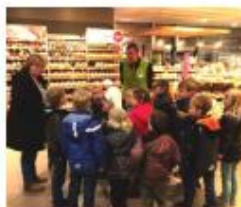
Een winkel bezoeken

"We hebben klusjes gedaan op school. Ook voor de directeur. We kregen overal muntjes voor. Die deden we in een eigen gemaakte spaarpot. Daardoor konden we dingen kopen in onze winkel met zelfgemaakte spulletjes. De winkel werd steeds groter. Een stukje van de winkel hebben we nog steeds."