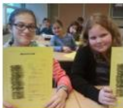
Maak je eigen zakgeldcontract

"We mochten met z'n tweeën zelf een dienst bedenken om te verkopen. Wij kozen voor onkruid wieden. Een echte verkoper kwam vertellen hoe je een dienst moet verkopen. Dat je goed moet vertellen wat je wel en niet doet, dat je heel beleefd moet zijn en ook van tevoren een prijs moet afspreken. We hebben samen wel 6,50 euro verdiend!"