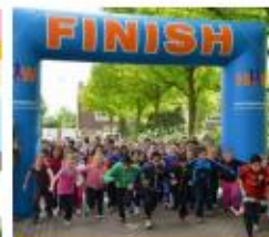
Organiseer een sponsoractie