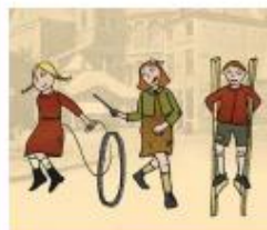
Speelgoed van toen

"Reclame moet je niet altijd geloven. Het lijkt soms mooier dan in het echt. We hebben een speelgoedmarkt gemaakt en mochten daarvoor ook reclame maken. Maar dan wel eerlijke reclame. Een mevrouw die veel over reclame maken wist, hielp ons. Papa's en mama's kwamen spulletjes kopen."