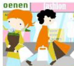
Consumeren en consuminderen

"Elk groepje kreeg 5 euro van de directeur te leen. Daar gingen we ons eigen bedrijf voor oprichten. We moesten geld gaan verdienen. Wij wilden armbandjes verkopen. Een ondernemer hielp ons met een begroting maken. We hebben kralen en touw ingekocht en slingers voor de versiering van onze kraam. De armbandjes hebben we voor 60 cent verkocht. Op het laatst hebben we de 5 euro teruggegeven aan de directeur en 220 euro ging naar het goede doel."