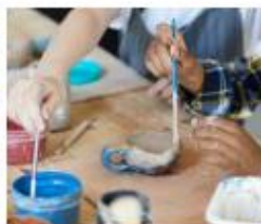
Maak een kado van klei