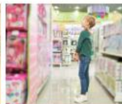
Kopen of niet kopen?