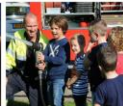
Doe een brandoefening