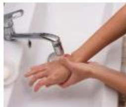
Koel een brandwond