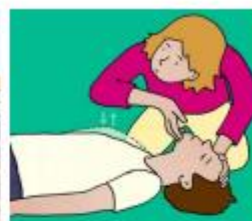
Handel bij bewusteloosheid