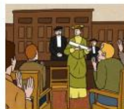
Leer over Aletta Jacobs

"Mijn opa is mijn held. Hij maakt me altijd blij en door hem kan ik goed kanoën. Vroeger had je ook helden. Aletta Jacobs is nog steeds een held. Door haar mag ik nu ook naar school. Michiel de Ruijter was een andere held. Dat varen vind ik wel stoer, maar ik vind hem geen echte held. We hebben van een meneer van het archief een rondleiding gehad langs beelden in ons dorp. Hij wist alles. Op het einde speelde ik een standbeeld van mijn eigen held."