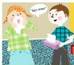
Haal hulp bij een bloedneus