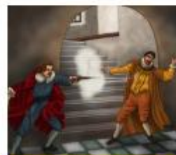
Leer over Willem van Oranje

Daarover ging mijn betoog. Dat mochten we schrijven op een middelbare school samen met 5-wo-leerlingen met het eindexamenvak geschiedenis."