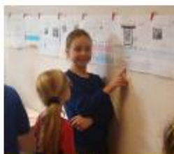
Maak een tijdbalk

"Eerst ging het project over de Gouden Eeuw en de VOC en hoe Nederland rijk werd. Maar zoals de handel toen ging, was niet eerlijk. Een exporteur in peren vertelde over hoe dat nu beter gaat. Ik maakte er een rap over. Met de klas maakten we ook een foodverhaal voor 2040. Het ging over een voedselmachine met lekker en gezond voedsel en genoeg voor iedereen."