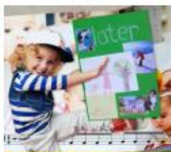
Zing: Toen, nu en later

"Het project ging over het leven van Annie M.G. Schmidt. Ze vonden haar vroeger niet netjes, omdat ze brutaal was. Nu vinden we haar normaal. We hebben haar liedjes gezongen. Over wassen in een teiltje. En over een kolenman die kolen met het paard bracht om te koken. We zijn ook naar een oud huis geweest. De keuken was ook een soort badkamer. Een hele oude meneer vertelde erover. Daarna maakte ik een drieliuk over mijn eigen leven vroeger, nu en later."