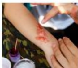
Schmink een schaafwond

"We leerden over soorten wonden. Een huisarts liet zien hoe je die wonden moet verzorgen en verbinden. En wanneer je wel of niet 112 moet bellen. Toen gingen we dat zelf doen. Eerst gingen we daarvoor bij elkaar verschillende soorten wonden schminken en daarna verzorgen. In een rollenspel moesten we laten zien of we op een goede manier 112 konden bellen."