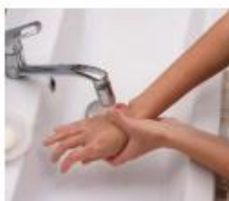
Koel een brandwond