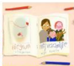
Maak een fotoboek