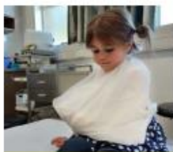
Maak een mitella

"Onze klas was een ziekenhuis met behandelkamers. Soms was ik dokter, soms patiënt. Een verpleger kwam op bezoek en nam spullen mee. Hij legde uit wat je daar mee kon doen en vertelde dat het belangrijk was om schoon te werken. Je wilt niet andere mensen ziek maken. Wij mochten de spullen gebruiken in ons ziekenhuis. We gingen toen steeds voor het spelen handen wassen en op het einde de spullen wassen."