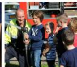
Doe een brandoefening