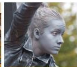
Speel een levend standbeeld