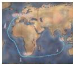
Wereldhandel en de VOC