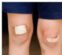
Plak een pleister

"Het project bestond uit een groot circuit. Elke dag leerden we iets anders over EHBO. Helpen bij een bult, schaafwond, bloedneus of tand eruit. Iemand met een EHBO-diploma hielp in het circuit. Ik wil later ook mijn EHBO-diploma hebben. Het is fijn om te kunnen helpen."