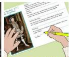
Portretten van machthebbers