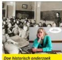
Doe historisch onderzoek