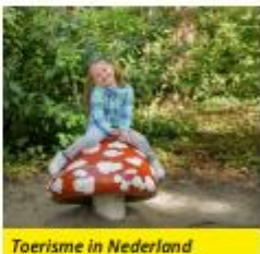
Toerisme in Nederland