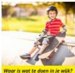
Waar is wat te doen in je wijk?

"We zijn eerst in het buurthuis geweest. We moesten daarna zelf een rondleiding maken door de wijk voor een nieuw klasgenootje. Ik gebruikte daarbij Google Earth. Dat was voor mijzelf ook heel leuk. Ik heb ontdekt dat er veel meer te doen is in onze buurt dan ik dacht."