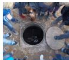
Buizen door de wijk

"Het project begon met een rondleiding door de wijk. Een man van de gemeente vertelde over het riool en de verlichting in de straat. We hebben ook papier geprikt in de straat. Ik wist niet dat voor de straat zorgen zoveel werk was."