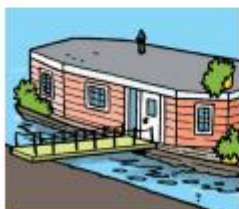
Soorten huizen herkennen

"Iedereen heeft zijn slaapkamer in het klein in een schoenendoos gemaakt. Daar hebben we toen een flat van gebouwd. Het dak is voor iedereen. Daarom hebben we er een speeltuin op gemaakt. De flat staat nu nog in de bouwhoek. We spelen er soms nog mee."