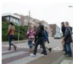
Ontdek je straat