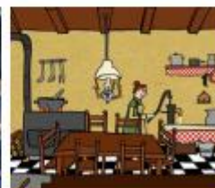
Zo zag een huis er vroeger uit