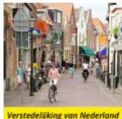
Verstedelijking van Nederland

"We hebben met de hele klas een wijk ontworpen. Elk groepje kreeg een stuk grond om in te richten. Toen we alle stukken grond aan elkaar legden, hadden we te veel zwembaden en te weinig huizen om in te wonen. Toen moesten we samen overleggen om er toch een goede wijk van te maken. Een mevrouw van de ruimtelijke ordening van de gemeente heeft ons plan beoordeeld."