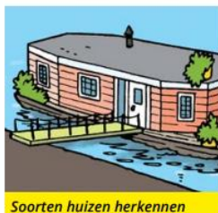
Soorten huizen herkennen

"Iedereen heeft zijn slaapkamer in het klein in een schoenendoos gemaakt. Daar hebben we toen een flat van gebouwd. Het dak is voor iedereen. Daarom hebben we er een speeltuin op gemaakt. De flat staat nu nog in de bouwhoek. We spelen er soms nog mee."