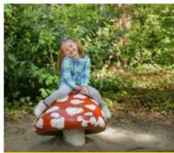
Toerisme in Nederland