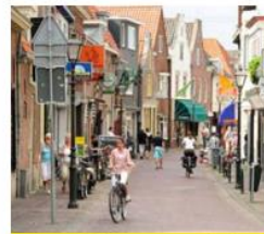
Verstedelijking van Nederland

"We hebben met de hele klas een wijk ontworpen. Elk groepje kreeg een stuk grond om in te richten. Toen we alle stukken grond aan elkaar legden, hadden we te veel zwembaden en te weinig huizen om in te wonen. Toen moesten we samen overleggen om er toch een goede wijk van te maken. Een mevrouw van de ruimtelijke ordening van de gemeente heeft ons plan beoordeeld."