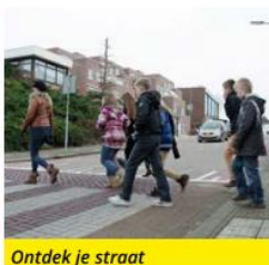
Ontdek je straat