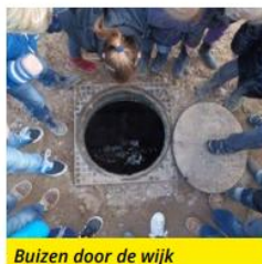
Buizen door de wijk

"Het project begon met een rondleiding door de wijk. Een man van de gemeente vertelde over het riool en de verlichting in de straat. We hebben ook papier geprikt in de straat. Ik wist niet dat voor de straat zorgen zoveel werk was."