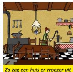
Zo zag een huis er vroeger uit