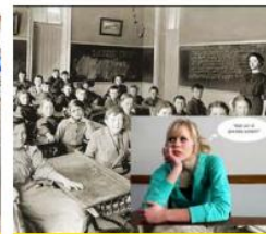
Doe historisch onderzoek