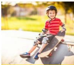
Waar is wat te doen in je wijk?

"We zijn eerst in het buurthuis geweest. We moesten daarna zelf een rondleiding maken door de wijk voor een nieuw klasgenootje. Ik gebruikte daarbij Google Earth. Dat was voor mijzelf ook heel leuk. Ik heb ontdekt dat er veel meer te doen is in onze buurt dan ik dacht."